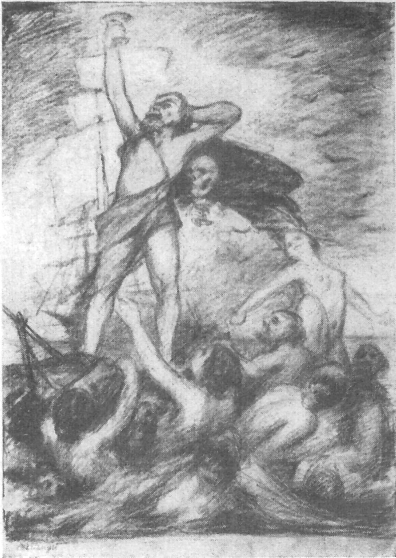
Rossz hajóval tengeren.